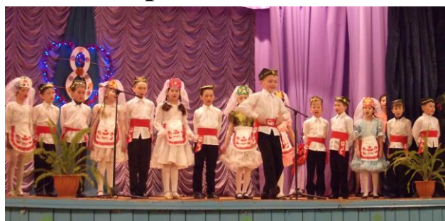
Коллектив 2 класса – победитель в младшей группе

5 марта в Центре досуга состоялся творческий конкурс с участием классных коллективов нашей школы. К этому конкурсу мы готовились очень долго: знакомились с народными песнями, слушали песни в исполнении профессиональных артистов, готовили костюмы.