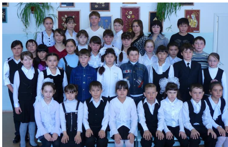
Хорошисты МОУ «Усть-Туркская СОШ»

Ребята, впереди IV четверть, не такая она уж длинная, поэтому не утешайте себя мыслями: «Еще успею, все сделаю, получу хорошие оценки». Если к учёбе будете относиться серьёзно, заниматься постоянно и ежедневно, тогда всё будет понятно и легко. От того, каких результатов вы добьётесь в учебе, зависит ваш успех в будущем.