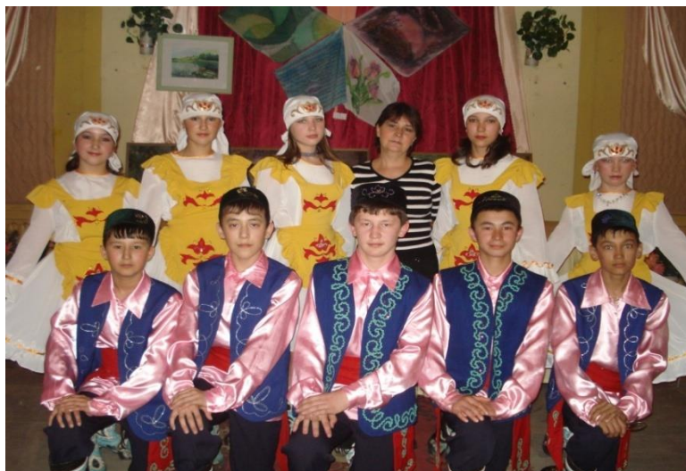
III состав ансамбля